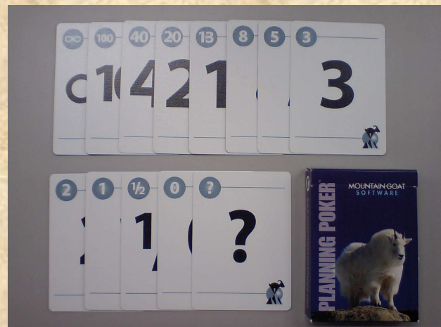
図 2 プランニングポーカーで使用するカード